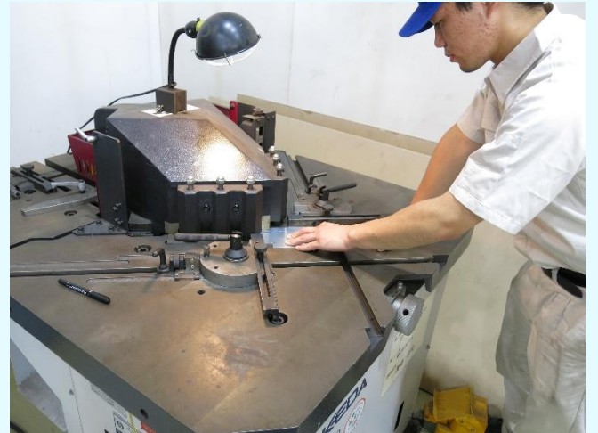
板金実習（コーナーシャー）