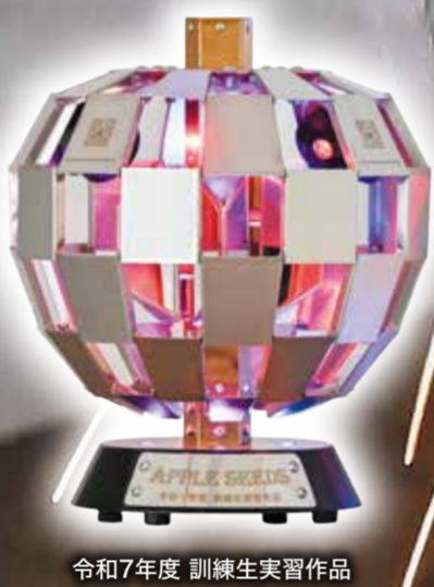
令和7年度 訓練生実習作品