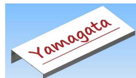
ネームスタンド(イメージ)