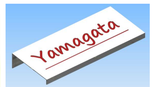
ネームスタンド(イメージ)