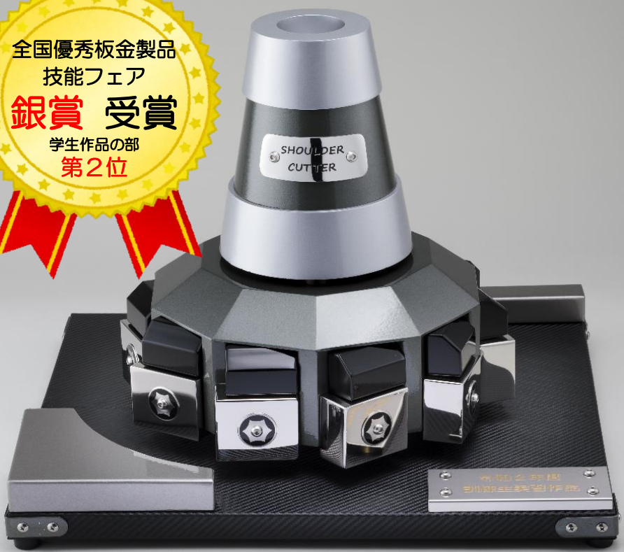
作品名：SHOULDER CUTTER (肩削りフライスカッタ)