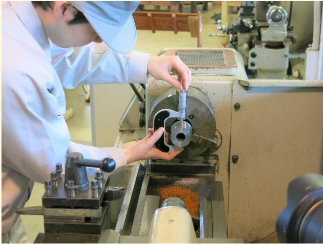
機械加工実習（旋盤）

令和4年度訓練生が入校して約2カ月が過ぎました。訓練生の第一期（4月～7月）の目標は、学科と実技を関連づけながら基礎・専門知識の理解と基本実技の習得に努めることです。日々の訓練を通じて、金属技術の奥深さを感じながら、個々の目標に向かって努力しています。