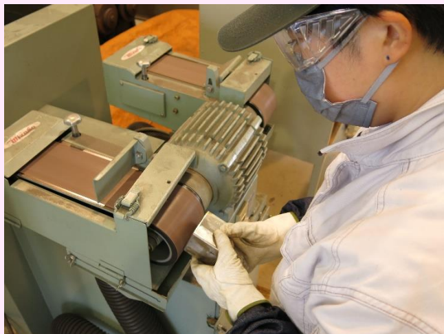
板金実習（仕上げ加工）

令和3年度訓練生が入校して約5カ月が過ぎました。金属技術科・第二期（8月～12月）の目標は、専門知識を更に向上させ、生産現場に即応した技術・技能の習得に努めることです。訓練生は、難易度の高い訓練に挑戦するとともに、就職活動にも力を入れ、希望する企業の採用内定を目指し、準備を進めています。