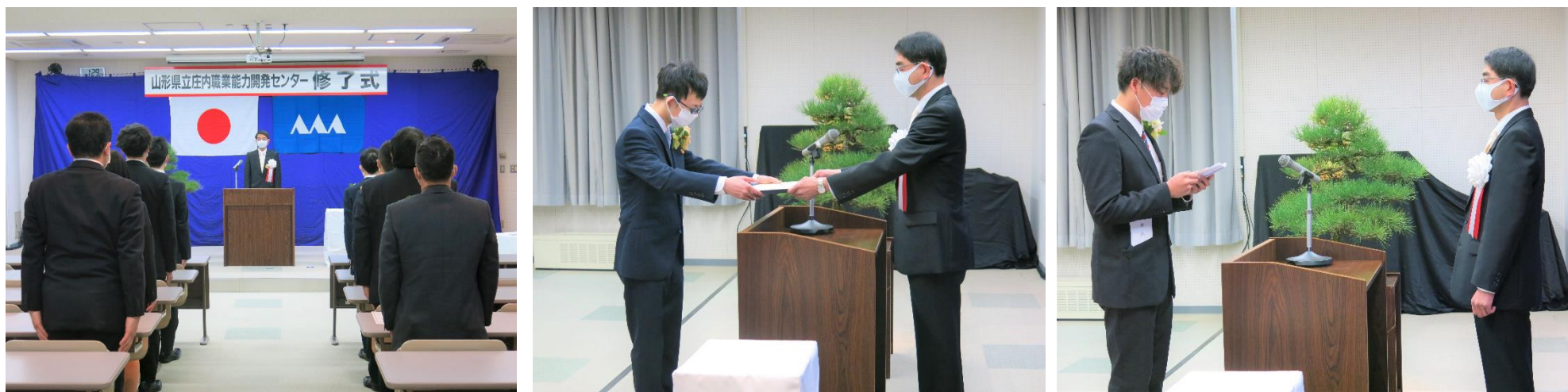
～ 修了式の様子 ～

○3月18日に修了式が行われました。式では、修了生代表より「センターで得た多くの知識・経験をそれぞれの職場で活かし、更なる技能の向上を目指したい」という決意の言葉が述べられました。修了生は主に、庄内地区の金属技術関連企業に入社予定です。(令和2年度 就職内定率 100%)