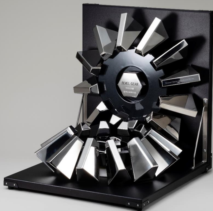
作品名：BEVEL GEAR (ベベルギヤ「かさ歯車」)