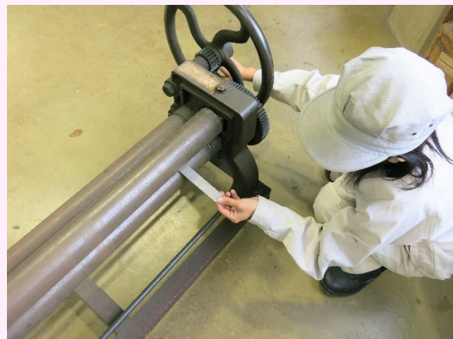
～ 板金製品技能フェア出展作品の製作 ～