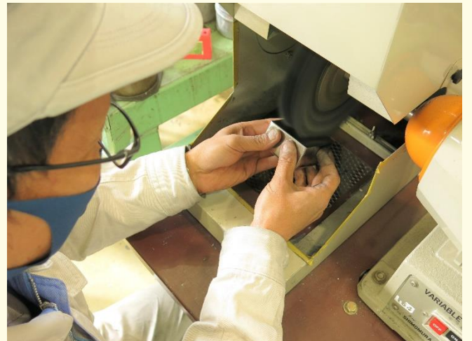
板金フェア出展作品の製作