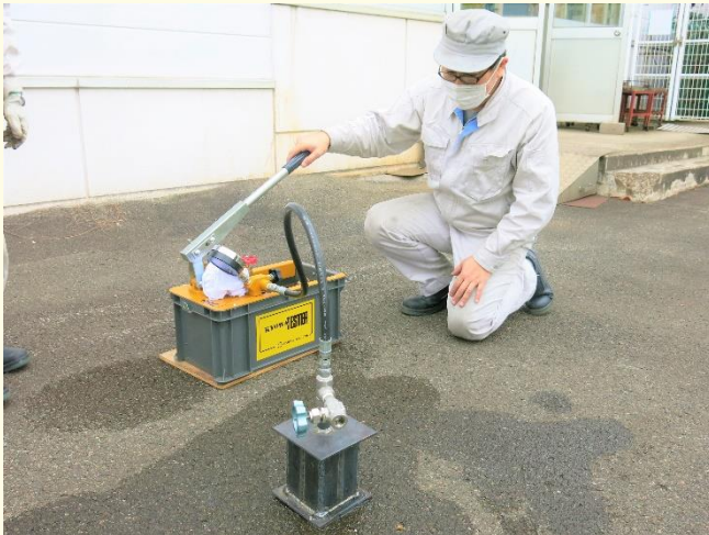
圧力容器の耐圧試験